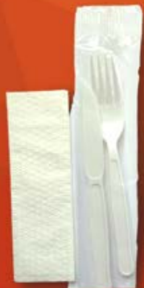
KIT GARFO E FACA C/ GUARDANAPO